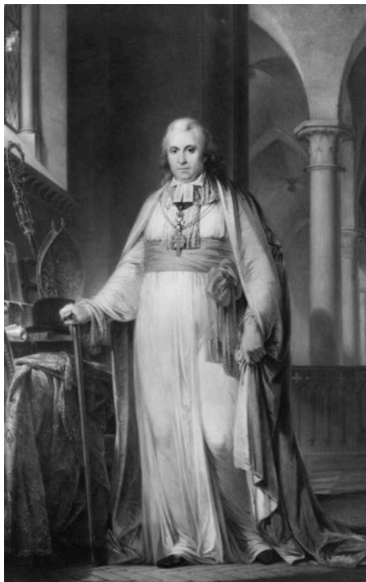
Lindblom som ärkebiskop. Att förse korset i halskedjan med strålar, såsom utmärkande ärkebiskopen är ett bestående bidrag som Lindblom lämnat efter sig.

När biskopsstolen i Linköping blev ledig 1786 fanns det fem personer på förslagsrummet. Men kungen för själv upp Lindblom på förslagsrummet. Och nu sätts vänskapen på prov mellan Lindblommarna och Wallenbergarna.